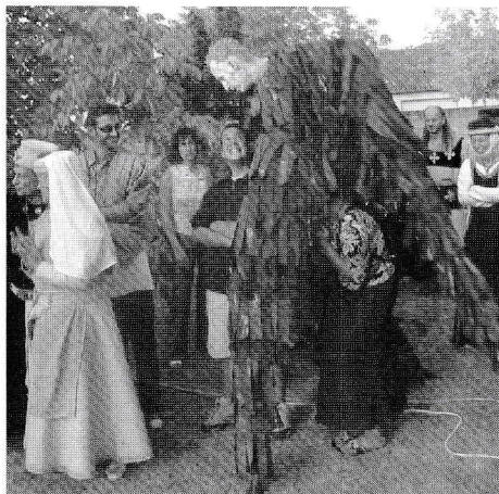
Groupe Nouaillé 1356 : L'extraordinaire homme feuilles